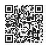
ユニバー記念競技場

ユニバー記念競技場 (補助競技場) 神戸市須磨区緑台 https://www.kobe-park.or.jp/sougou/facilities/memorialstadium/