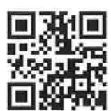
▲障害者スポーツ振興センター

神戸市障害者スポーツ振興センター ホームページよりお申込みください。 https://www.kobesad.jp/ 神戸市社会福祉協議会ホームページ 「ラブ・リングこうべ」からもお申込みいただけます。 https://www.with-kobe.or.jp/