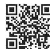
▲ラブ・リングこうべ