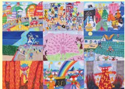
HUG+展2023 最優秀賞 オリジナルキャラクターの世界 渡邊 賢志郎(青陽東絵画教室)