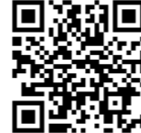
▲ラブ・リングこうべ