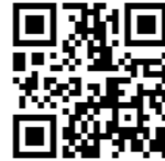
▲障害者スポーツ振興センター

神戸市社会福祉協議会ホームページ 「ラブ・リングこうべ」からもお申込みいただけます。 https://www.with-kobe.or.jp/