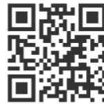
▲障害者スポーツ振興センター

神戸市社会福祉協議会ホームページ 「ラブ・リングこうべ」からもお申込みいただけます。 https://www.with-kobe.or.jp/