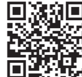
▲ラブ・リングこうべ